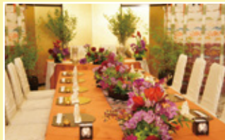
4階和室 高砂(たかさご) 着席～20名様