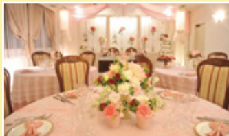
4階バンケット スワニー 着席：～26名様

ゆっくりとお食事を 召し上がりながら お過ごしいただける 貸切個室をご用意。 洋室・和室から お選びいただけます。