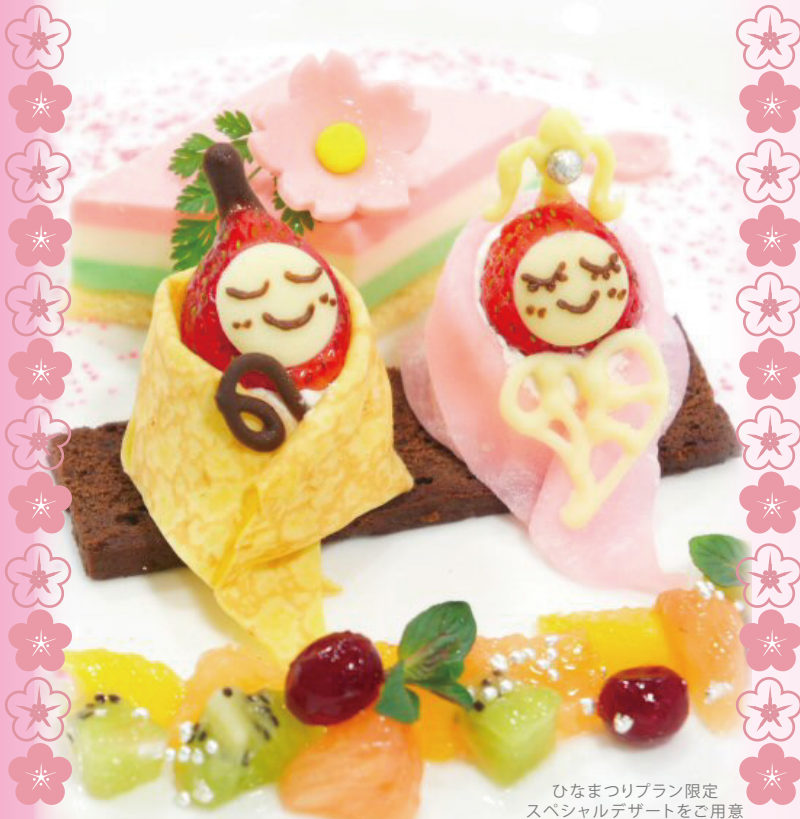
ひなまつりプラン限定 スペシャルデザートをご用意